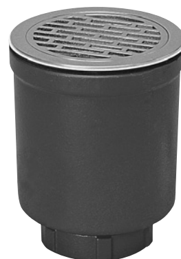
■寸法表 (単位 : mm)